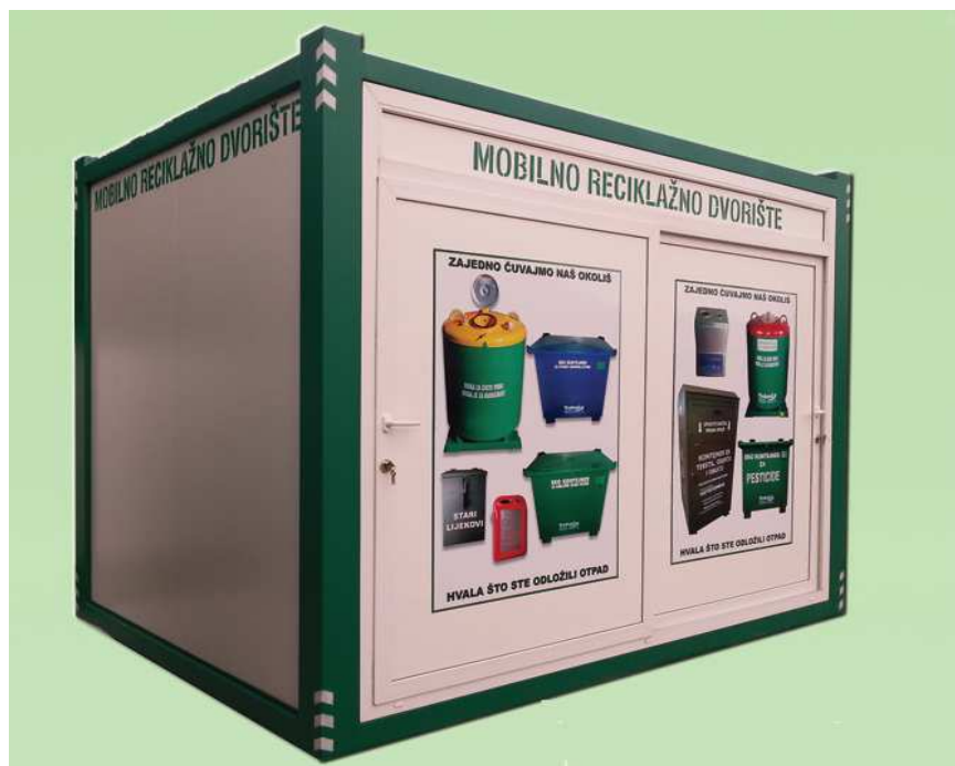
Slika 8.2.-1.: Primjer mobilnog reciklažnog dvorišta

U 2015. godini Grad Komiza je osigurala od Fonda za zaštitu okoliša i energetske efikasnost sredstva za nabavu mobilnog reciklažnog dvorišta.