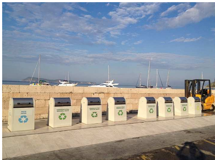
Slika 8.4.-2.: Podzemni zeleni otok u gradu Komiži

U naselju Komiža postavljeno je 5 zelenih otoka, kapaciteta kontejnera od 1100 l. Jedan zeleni otok, postavljen na lokaciji u blizini lukobrana, sastoji se od 8 podzemnih kontejnera kapaciteta 1100 l (Slika 8.4.-2).