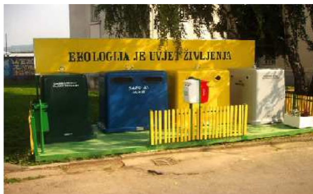
Slika 8.4.-1.: Primjeri zelenih otoka

Kriterij za lokaciju zelenih otoka će biti gustoća naseljenosti, uvažavanje slobodne površine za smještaj zelenog otoka.