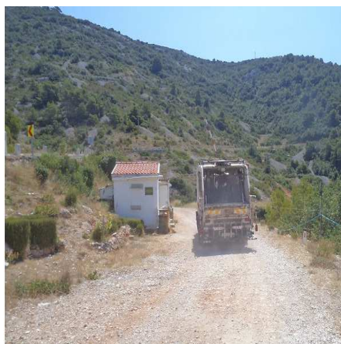
Slika 5.-1.: Lokacija odlagališta Šćeće

Odlagalište je pod upravom tvrtke Nautički centar Komiža d.o.o. od 2010. godine. Na početku ulaza na odlagalište nalazi se stražarska kućica i rampa, udaljena 300 m od tijela odlagališta. Odlagalište se nadzire 24 sata. Na odlagalištu je izvedena i hidrantska mreža, a oprema za gašenje požara se nalazi u stražarskoj kućici.